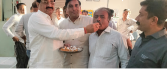
આવ્યો છે. આ ફીડરની શરૂઆત ધારાસભ્ય જે.વી. કાકડીયાના હસ્તે કરવામાં આવી હતી. આ તકે અમરેલી જિલ્લા ભાજપ પ્રમુખ

ધારી, તા. ૧૬ ધારી તાલુકાના વેકરીયા ગામમાં આવેલ ૬૬ કેવી કાથરોટા, ૧૧ કેવી ખેતીવાડી ફિડર લોડિંગના કારણે ખેડૂતો સમસ્યાનો સામનો કરી રહ્યા હતા. આ સમસ્યાને અનુલક્ષી, ફિડરનું બાયકેક્શન કરીને નવો ૧૧ કેવી બેખડ ખેતીવાડી ફિડર સ્થાપિત કરવામાં