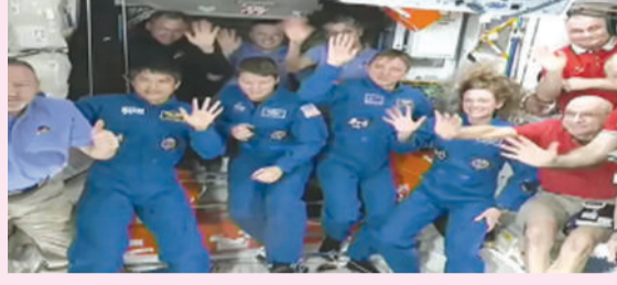
જાપાનના ટાકુયા ઓનિશી અવકાશ મથક પર પહોંચ્યા હતા. કૂ-૯ એ તેમનું સ્પેસ સ્ટેશનમાં સ્વાગત કર્યું હતું. બોઈંગના સ્ટારલાઈનરમાં ખામીને કારણે ૮ દિવસની મુસાફરી ૯ મહિનામાં ફેરવાઈ ગઈ હતી.