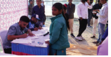
સ્થિત સરદાર પટેલ રમત સંકુલ ખાતે કરવામાં આવ્યું હતું. જિલ્લાકક્ષા બેટરી ટેસ્ટમાં ૪૫૦ ખેલાડીઓએ ઉત્સાહપૂર્વક ભાગ લીધો હતો. આ બેટરી ટેસ્ટમાંથી પસંદગી પામેલા ખેલાડીઓ રાજ્યકક્ષાની બેટરી ટેસ્ટમાં ભાગ લેવા જશે અને તેમાંથી પસંદ થયેલા ખેલાડીઓ જિલ્લાકક્ષા સ્પોર્ટ્સ સ્કૂલમાં પ્રવેશ મેળવશે.

આવે છે. જેમાં અમરેલી જિલ્લામાં પેલ મહાકુંભ ૩.૦ અંતર્ગત અંડર ૦૮, અંડર-૧૧ના તાલુકાકક્ષા એથલેટિક્સ રમતમાં ૩૦ મીટર દોડ, ૫૦ મીટર દોડ, સ્ટેન્ડીંગ શ્રોડ જમ્ સ્પર્ધામાંથી ૧ થી ૮ વિજેતા ભાઈઓ-બહેનોને અલગ તારવી જિલ્લાકક્ષા બેટરી ટેસ્ટનું આયોજન તા. ૧૧.૦૩.૨૦૨૫ અને તા. ૧૨.૦૩.૨૦૨૫ના અમરેલી