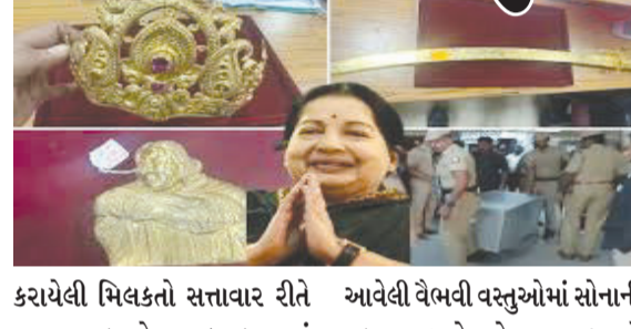
કરાયેલી મિલકતો સત્તાવાર રીતે રાજ્ય સરકારને ટ્રાન્સફર કરવામાં આવી હતી. કર્ણાટક સત્તાવાળાઓ દ્વારા તમિલનાડુને સોંપવામાં આવેલી વૈભવી વસ્તુઓમાં સોનાની તલવાર અને સોનાના મુગટનો સમાવેશ થાય છે. યાદીમાં રહેલી વસ્તુઓમાં શરીર પર મોરપીંછની

બેંગલુરુ, તા. ૧૬ બેંગલુરુની એક ખાસ સીબીઆઈ કોર્ટે જયલલિતાની સંપત્તિ અંગે એક મહત્વપૂર્ણ ચુકાદો આપ્યો છે. સીબીઆઈ કોર્ટે બુધવારે તમિલનાડુના ભૂતપૂર્વ મુખ્યમંત્રી સ્વર્ગસ્થ જયલલિતાની જન્મ કરાયેલી બધી સંપત્તિ તમિલનાડુ સરકારને ટ્રાન્સફર કરવાનો આદેશ જારી કર્યો હતો. બેંગલુરુ કોર્ટના આદેશના એક દિવસ પછી, જન્મ