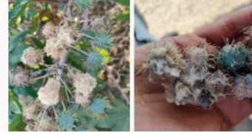
ગ્રે (રાખોડી) મોલ્ડ માટે

ગ્રે (રાખોડી) મોલ્ડ પ્રથમ વખત ૧૯૧૮માં યુએસએમાં નોંધાયો હતો, અને તેના પ્રસારના કારણે પાકની ઉપજમાં ૧૦૦% સુધીનું નુકસાન થતું જોવા મળ્યું હતું. ભારતમાં આ રોગ ૧૯૨૧માં કણાટકમાં જોવા મળ્યો હતો. ભારતનાં અન્ય રાજ્યો જેવા કે તામિલનાડુ અને આંધ્રપ્રદેશમાં ૧૯૮૭ આ રોગ નોંધાયેલ હતો, જે એરંડા ઉત્પાદન પર ગંભીર અસર ધરાવતો હતો. જેના કારણે એરંડાના ઉત્પાદનમાં ભારે ઘટાડો થયો હતો. ૨૦૦૦-૨૦૦૧માં તેલંગાણા રાજ્યમાં ગ્રે (રાખોડી) મોલ્ડના કારણે એરંડાનો ખેતી વિસ્તાર ૩.૯૨ લાખ હેક્ટર સુધી ઘટી ગયો હતો. આ રોગ રશિયા, યુક્રેન, જર્મની, થાઈલેન્ડ, જાપેક