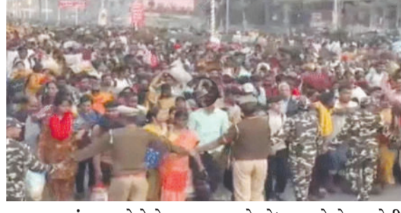
આ ઘટનામાં ઘણા લોકોએ જીવ ગુમાવ્યા છે. ભાગદોડની તપાસ કરવા અને ઘટના પાછળના કારણો શોધવા માટે બે સભ્યોની ઉચ્ચ સ્તરીય સમિતિની રચના કરવામાં આવી છે. તે જ સમયે,

પરની એક પોસ્ટમાં, પીએમ મોદીએ કહ્યું: 'નવી દિલ્હી રેલવે સ્ટેશન પર થયેલી ભાગદોડ (જેવી પરિસ્થિતિ)થી હું દુઃખી છું. જેમણે પોતાના પ્રિયજનો ગુમાવ્યા છે તેમના પ્રત્યે મારી સંવેદના છે. ઘાયલ લોકો જલ્દી સ્વસ્થ થાય તેવી પ્રાર્થના કરું છું.' સંરક્ષણ પ્રધાન રાજનાથ સિંહ અને દિલ્હીના લેફ્ટનન્ટ ગવર્નર વીકે સક્સેનાએ જણાવ્યું હતું કે