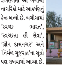
જળહળતો આ બગીચો નાગરિકો માટે આકર્ષણનું કેન્દ્ર બન્યો છે. બગીચામાં ‘સ્વચ્છ ભારત’, ‘સ્વચ્છતા હી સેવા’, ‘શ્રીન દામનગર’ અને ‘નિર્મળ ગુજરાત’ના સૂત્રો પણ લખવામાં આવ્યા છે.

દામનગર, તા. ૧૬ દામનગર શહેરના મધ્ય વિસ્તારમાં હવેલી નજીક સ્વર્ણિમ જયંતી મુખ્યમંત્રી શહેરી વિકાસ યોજના અંતર્ગત બનાવાયેલા ત્રિકોણ બાગની સુંદરતા જાળવવા માટે નિયમિત જાળવણીની જરૂરિયાત ઊભી થઈ છે. નગરપાલિકા દ્વારા વર્ષ ૨૦૨૩-૨૪ની ગ્રાન્ટમાંથી આ બગીચામાં ૧૫ બાકડા અને ૧૮ વૃક્ષોનું રોપણ કરવામાં આવ્યું છે. સાંજથી સવાર સુધી LED લાઈટ્સથી