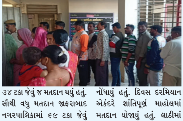
૩૪ ટકા જેવું જ મતદાન થયું હતું. નોંધાયું હતું. દિવસ દરમિયાન એકંદરે શાંતિપૂર્ણ માહોલમાં નગરપાલિકામાં ૬૯ ટકા જેવું મતદાન યોજાયું હતું. લાઠીમાં

અમરેલી, તા. ૧૬ અમરેલી જિલ્લામાં લાઠી, ચલાલા, રાજુલા, જાફરાબાદ એમ ચાર નગરપાલિકાની ચૂંટણીનું વહેલી સવારથી મતદાન શરૂ થયું હતું. જે સાંજે ૭ વાગ્યે શાંતિપૂર્ણ માહોલમાં પૂર્ણ થયું હતું. આ ઉપરાંત સાવરકુંડલા, દામનગર, અમરેલી અને મીઠાપુર ડુંગરી તાલુકા પંચાયતની પેટાચૂંટણીમાં પણ શાંતિપૂર્ણ માહોલમાં મતદાન