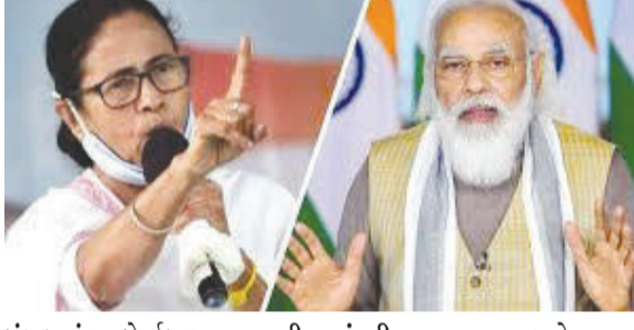
બંગાળમાં આ ફોર્મ્યુલા અજમાવવાની તૈયારી કરી રહ્યું છે. પાર્ટીનું માનવું છે કે દિલ્હીમાં સફળતા પાછળ, સૂંટણી વ્યવસ્થાપન અને સૂક્ષ્મ વ્યવસ્થાપનની સાથે મજબૂત ઉમેદવારોએ મહત્વપૂર્ણ ભૂમિકા ભજવી હતી. હવે આ જ રણનીતિ બંગાળમાં અપનાવવામાં આવશે જ્યાં આવતા વર્ષે વિધાનસભાની ચૂંટણીઓ યોજાવાની છે. ભાજપ સંગઠન પહેલાથી જ મેદાનમાં ઉતરી ચૂક્યું છે અને સંપૂર્ણ યોજના સાથે ચૂંટણીની જવાબદારી સંભાળવાની તૈયારી કરી રહ્યું છે. વાસ્તવમાં, પશ્ચિમ બંગાળના એક વરિષ્ઠ ભાજપ નેતાને ટાંકીને મીડિયા રિપોર્ટમાં કેટલીક બાબતો શેર કરવામાં આવી છે.

નવીદિલ્હી, તા. ૧૬ ૨૭ વર્ષ પછી દિલ્હીમાં જીત મેળવ્યા બાદ, ભાજપ હવે પશ્ચિમ જવાહર નવોદય & સેનિટ રક્ત અમરેલી ધો.5 CET માટે ટયુશન - હોસ્ટેલ - અપડાઉન લાઈ રોડ બાયપાસ ચોકડી રોહિત ખોષી - અમરેલી Mo.94294 33031 Mo.90676 06698