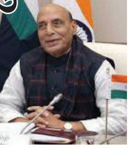
એરો ઈન્ડિયા ૨૦૨૫ના ઉદ્ઘાટન કર્યા પછી બોલતા, સંરક્ષણ પ્રધાન રાજનાથ સિંહે

એરો ઈન્ડિયા ૨૦૨૫ ની ૧૫મી આવૃત્તિ બેંગલુરુના ચેલહાંકા એરફોર્સ સ્ટેશન ખાતે ચાલી રહી છે. જેમાં સંરક્ષણ મંત્રી રાજનાથ સિંહે પણ સંબોધન કર્યું છે. આ દરમિયાન રાજનાથ સિંહે વૈશ્વિક અનિશ્ચિતતાઓનો ઉલ્લેખ કરતા કહ્યું કે એક મોટા દેશ તરીકે, ભારત હંમેશા શાંતિ અને સ્થિરતાનું સમર્થક રહ્યું છે.