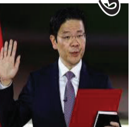
કેન્દ્રબિંદુ રહે અને સમુદાયના કેન્દ્ર તરીકે મંદિરની સ્થિતિ મજબૂત બને તે સુનિશ્ચિત કરવા માટે આ પવિત્ર વિધિ યોજવામાં આવે છે. સિંગાપોરમાં આ

સિંગાપોરના વડાપ્રધાન લોરેન્સ વૉંગે ઉત્તર સિંગાપોરમાં માર્સિલિંગ રાઈઝ હાઉસિંગ એસ્ટેટમાં શ્રી શિવ-કૃષ્ણ મંદિરમાં પ્રાણ પ્રતિષ્ઠા સમારોહમાં ૧૦,૦૦૦ થી વધુ ભક્તો સાથે જોડાયા હતા. મંદિરમાં આ ત્રીજો પ્રાણ પ્રતિષ્ઠા સમારોહ છે - તે અગાઉ ૧૯૯૬ અને ૨૦૦૮માં યોજાયો હતો. મંદિર આધ્યાત્મિક પ્રવૃત્તિનું