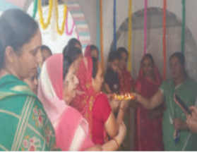
વાતાવરણ છવાયું હતું. આ પ્રસંગે સમૂહ આરતી, ભોજન પ્રસાદ અને પૂજન સહિતના કાર્યક્રમો યોજાયા હતા, જેમાં મોટી સંખ્યામાં ભાવિકોએ ભાગ લીધો હતો.