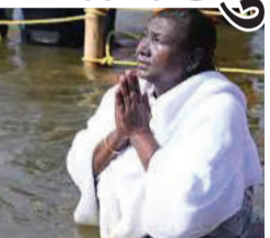
પ્રવાહ સરસ્વતીના પવિત્ર સંગમ પર સ્નાન કરવાની તક મળી. હું માતા ગંગાને પ્રાર્થના કરું છું કે તે બધા પર પોતાના આશીર્વાદ વરસાવતી રહે અને બધાના જીવનમાં સુખ અને શાંતિ લાવતી રહે.

રાષ્ટ્રપતિ દ્રૌપદી મુર્મુ ઉત્તર પ્રદેશના પ્રયાગરાજમાં મહાકુંભમાં પહોંચ્યા હતા. આ પ્રસંગે રાજ્યપાલ આનંદીબેન પટેલે તેમનું સ્વાગત કર્યું હતું. તેમણે ત્રિવેણી સંગમમાં સ્નાન કર્યું. સોશિયલ મીડિયા પર શેર કરેલી પોસ્ટમાં તેમણે કહ્યું કે પ્રયાગરાજ મહાકુંભના દિવ્ય વાતાવરણમાં તેમને મા ગંગા, યમુના અને ભૂગર્ભ