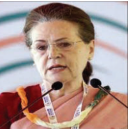
રાજ્યસભામાં શૂન્યકાળ દરમિયાન આ મુદ્દો ઉઠાવતા તેમણે એમ પણ કહ્યું કે પાઠ્ય સુરક્ષા એ કોઈ વિશેષાધિકાર નથી પરંતુ

કોંગ્રેસના વરિષ્ઠ નેતા અને પાર્ટી સંસદીય પક્ષના અધ્યક્ષ સોનિયા ગાંધીએ સોમવારે શક્ય તેટલી વહેલી તકે વસ્તી ગણતરી હાથ ધરવાની માંગ ઉઠાવી. તેમણે કહ્યું કે દેશમાં શક્ય તેટલી વહેલી તકે વસ્તી ગણતરી હાથ ધરવામાં આવે જેથી તમામ પાત્ર વ્યક્તિઓને પાઠ્ય સુરક્ષા કાયદા હેઠળ ગેરંટીકૃત લાભો મળી શકે.