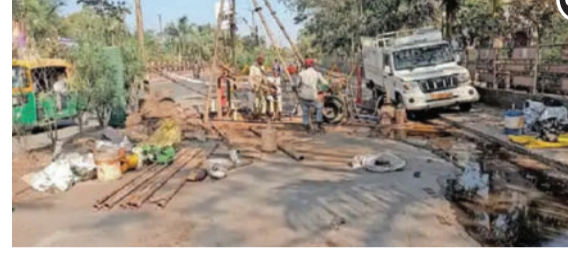
અમરેલી ખીજડીયા બ્રોડગેજનું કામ તેજ ગતિથી શરૂ કરાયું છે. આ કામના ભાગરૂપે અમરેલીમાં

અગાઉ બ્રોડગેજ ચાલુ કરાવવા માટે વિવિધ સંસ્થાઓ દ્વારા પ્રયત્નો હાથ ધરાયા હતા. ત્યારે હાલ અમરેલીના લાઠી રોડ પર તંત્રએ ઓવરબ્રિજ માટે જમીન ચકાસણીની પ્રક્રિયા હાથ ધરી છે. અહીં જુદા જુદા ૬ સ્થળે ૩૦ ફૂટ ઉંચેથી માટીના નમૂના લેવામાં આવ્યા છે. ઉલ્લેખનીય છે કે હાલમાં