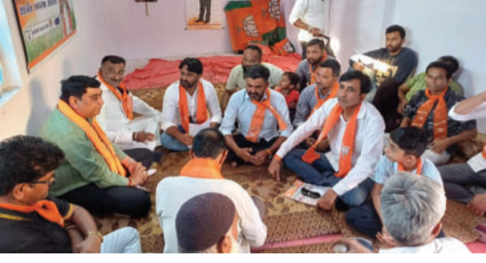
જનકભાઈ તળાવીયાએ શહેરના વિવિધ વિસ્તારોમાં જઈને ભાજપ માટે જનસંપર્ક કર્યો હતો.

લાઠી નગરપાલિકા ચૂંટણીમાં ભાજપે ઝંઝાવાતી પ્રચાર શરૂ કર્યો છે. લાઠી-બાબરાના ધારાસભ્ય જનકભાઈ તળાવીયાએ શહેરના વિવિધ વિસ્તારોમાં જઈને ભાજપ માટે જનસંપર્ક કર્યો હતો. ભાજપની બોડી આવશે તો શહેરના પ્રાણપ્રશ્નોને વાચા અપાશે તેવી ખાતરી આપતા, જનતાનો જબ્બર પ્રતિસાદ મળ્યો