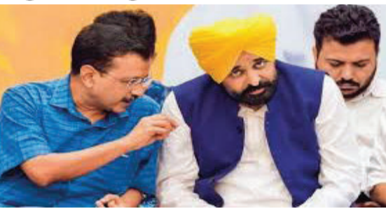
ચંડીગઢમાં યોજાશે. સરકાર હવે ફક્ત પંજાબમાં જ બચી છે. કોંગ્રેસના વરિષ્ઠ નેતા અને વિપક્ષી નેતા પ્રતાપ સિંહ

દિલ્હી ચૂંટણીમાં કારમી હાર બાદ પંજાબ આમ આદમી પાર્ટીમાં હલચલ વધુ તીવ્ર બની છે. પાર્ટીના રાષ્ટ્રીય કન્વીનર મંગળવારે રાજ્યના તમામ ધારાસભ્યોને દિલ્હીમાં બેઠક માટે બોલાવ્યા છે. આ કારણે આજે યોજનારી પંજાબ સરકારની કેબિનેટ બેઠક મુલતવી રાખવામાં આવી છે. હવે આ બેઠક ૧૩ ફેબ્રુઆરીએ બપોરે ૧૨ વાગ્યે