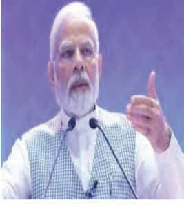
એક્શન સમિટના સહ-અધ્યક્ષપદ માટે આતુર છું, જે વિશ્વ નેતાઓ અને વૈશ્વિક ટેક સીઈઓનો મેળાવડો

પેરિસની મુલાકાતે જતા પહેલા, વડાપ્રધાન નરેન્દ્ર મોદીએ ફ્રાન્સ અને અમેરિકા સાથે ભારતની વ્યૂહાત્મક ભાગીદારીને વધુ મજબૂત બનાવવાની ઈચ્છા વ્યક્ત કરી છે. ફ્રાન્સ જતા પહેલા પોતાના નિવેદનમાં પીએમ મોદીએ કહ્યું, “રાષ્ટ્રપતિ મેક્રોનના આમંત્રણ પર હું ૧૦-૧૨ ફેબ્રુઆરી દરમિયાન ફ્રાન્સની મુલાકાત લઈશ. હું પેરિસમાં એઆઈ