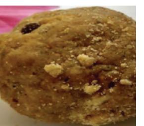
સાથે સંકળાયેલા છે પરંતુ મંદિરને પશુ ચરબીવાળું ધી પૂરું પાડવામાં સામેલ છે. શ્રી વેંકટેશ્વર સ્વામી મંદિરમાં ભક્તોને પ્રસાદ તરીકે