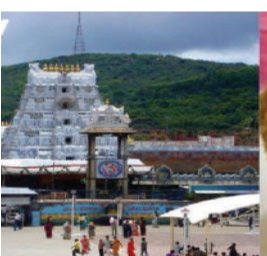
ઈન્વેસ્ટિગેશન ટીમ (એસઆઈટી) ની રચના કરવામાં આવી હતી. આ જ ટીમે ચાર લોકોની ધરપકડ કરી છે જેઓ અલગ અલગ ડેરીઓ

આંધ્રપ્રદેશના તિરુપતિ મંદિરના લાડુ વિવાદમાં સ્પેશિયલ ઈન્વેસ્ટિગેશન ટીમે ચાર લોકોની ધરપકડ કરી છે. તિરુપતિ મંદિરના લાડુમાં પ્રાણીની ચરબી હોવાનું બહાર આવ્યું. આ પછી, દેશભરમાં ભક્તોનો ગુસ્સો જોવા મળ્યો. આ કેસની તપાસ માટે સેન્ટ્રલ બ્યુરો ઓફ ઈન્વેસ્ટિગેશન (સીબીઆઈ) ના નેતૃત્વમાં એક સ્પેશિયલ