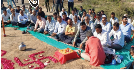
પ્રમુખ, નગરપાલિકા સદસ્ય, તાલુકા ભાજપ પ્રમુખ, તાલુકા ભાજપ મહામંત્રી, પૂર્વ તાલુકા