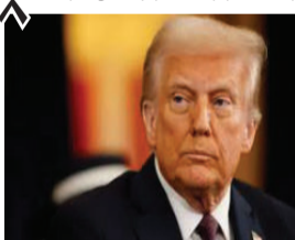
અમેરિકન રાષ્ટ્રપતિએ કહ્યું, “લાંબા સમયથી, અમેરિકા બે સેન્ટથી વધુ કિંમતના સિક્કા બનાવી રહ્યું છે.” આ અર્થહીન છે. જેથી મેં ટ્રેઝરી સેક્રેટરીને નવા સિક્કા બનાવવાનું બંધ કરવાનો નિર્દેશ આપ્યો છે.

અમેરિકા હવે નવા સિક્કા છાપશે નહીં. રાષ્ટ્રપતિ ડોનાલ્ડ ટ્રમ્પે યુએસ ટ્રેઝરી ડિપાર્ટમેન્ટને નવા સિક્કા ન બનાવવાનો નિર્દેશ આપ્યો છે. ટ્રમ્પ અમેરિકન અર્થતંત્રને મજબૂત બનાવવા માટે સતત નક્કર પગલાં લઈ રહ્યા છે. ટ્રમ્પે કહ્યું કે તેમણે ટ્રેઝરી વિભાગને એક સેન્ટના સિક્કાના ઉત્પાદન ખર્ચનો હવાલો આપીને નવા સિક્કા બનાવવાનું બંધ કરવાનો નિર્દેશ આપ્યો છે.