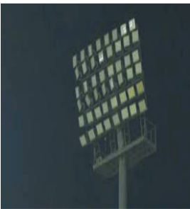
પ્રધાન મોહન ચરણ માઝી અને અન્ય વરિષ્ઠ પ્રધાનો સાથે સ્ટેડિયમમાં હાજર હતા. તેમણે કહ્યું, ‘ફલડલાઈટ્સની સમસ્યા