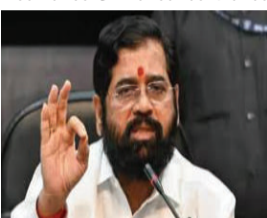
મને લાગ્યું કે જો તેમને ‘ધનુષ્ય અને તીર’ ચૂંટણી ચિહ્ન મળે, તો મત ભાજપ અને શિવસેના વચ્ચે વહેંચાઈ જશે, જેનો ફાયદો અન્ય પક્ષોને થશે. એટલા માટે મેં ના પાડી. તેમણે યુતિ ધર્મ (ગઠબંધન પ્રત્યેની પ્રતિબદ્ધતા)નું સન્માન કરવું પડશે.

મહારાષ્ટ્રના નાયબ મુખ્યમંત્રી અને શિવસેનાના વડા એકનાથ શિંદેએ દિલ્હી વિધાનસભા ચૂંટણીને લઈને મોટો દાવો કર્યો છે. એકનાથ શિંદેએ કહ્યું કે આમ આદમી પાર્ટીના ૧૫ ઉમેદવારોએ દિલ્હી વિધાનસભા ચૂંટણી લડવા માટે તેમની પાર્ટીનું ચૂંટણી ચિહ્ન માંગ્યું હતું, પરંતુ તેમણે ‘યુતિ ધર્મ’ને કારણે ના પાડી દીધી. શિંદેએ કહ્યું, ‘આમ આદમી પાર્ટીના કુલ ૧૫ ઉમેદવારોએ મારો સંપર્ક કર્યો હતો.