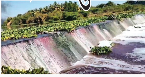
પણ દૂષિત થાય છે. તેમજ આ પાણી પશુઓ પણ પી શકતાં નથી. આજુબાજુના ફતેપુર, ચાંપાથળ સહિતના કિનારાના ગામમાં લાલ અને ફીણવાળા દૂષિત પાણીના કારણે લોકોનું આરોગ્ય જોખમમાં મુકાયું છે અને રોગચાળો વકરવાની

નદી પર બાંધવામાં આવેલા ચેકડેમોના પાણી પણ બગડ્યા છે. દૂષિત પાણી ફીણવાળું અને લાલ કલરનું છે. જેને કારણે પાણીમાં રહેલા જીવ સુષ્ટી સામે પણ પડકાર ઉભો થયો છે. આ અંગે સ્થાનિકોએ જણાવ્યું છે કે, લાલ પાણીનાં કારણે જમીનના તળ ખરાબ થાય છે અને ખેતરોનાં પાક