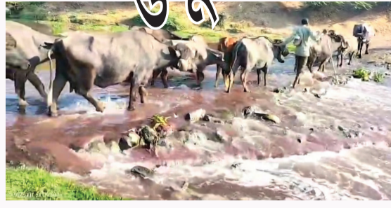
આરોગ્ય જોખમમાં મુકાયું છે અને રોગચાળો વકરવાની

ભીતિ સેવાઈ રહી છે. હાલ તો આ લાલ અને ફીણવાળું દૂષિત પાણી ક્યાંથી આવે છે તે જાણવા મળ્યું નથી. આ અંગે તંત્ર દ્વારા તાત્કાલિક અસરથી કાર્યવાહી કરવામાં આવે તેવી આ વિસ્તારના લોકોએ માંગ કરી છે. આ ઉપરાંત ફતેપુર ખાતે વિશ્વ વિખ્યાત સંત ભોજલરામબાપાનું મંદિર પણ