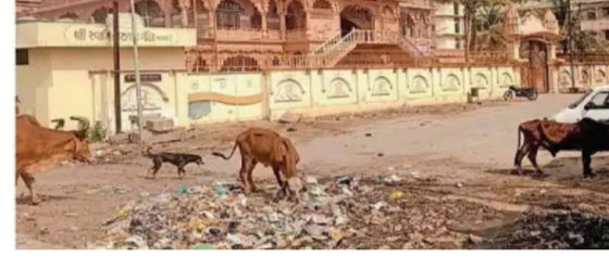
અમરેલીમાં આવેલ જુદા જુદા માર્ગો પર સફાઈનો અભાવ જોવા મળતા કચરાનાં ગંજ ખડકાયા છે. અમરેલીના પાણી દરવાજા નજીક સ્વામિનારાયણ મંદિર સામે કચરો ઠાલવવાના કન્ટેનરની કોઈ વ્યવસ્થા

અમરેલી, તા.૦૫ અમરેલીમાં માર્ગ પર તો ગંદકીના ઢગ ખડકી દેવામાં આવતા હતા પરંતુ હવે ધાર્મિક સ્થળો સામે પણ ગંદકી થવા લાગી છે. અમરેલીના પાણી દરવાજા પાસે આવેલ સ્વામિનારાયણ મંદિર સામે જ સફાઈનો અભાવ જોવા મળે છે. જેના કારણે શહેરના લોકોમાં પાલિકા સામે રોષ ફેલાયો છે.