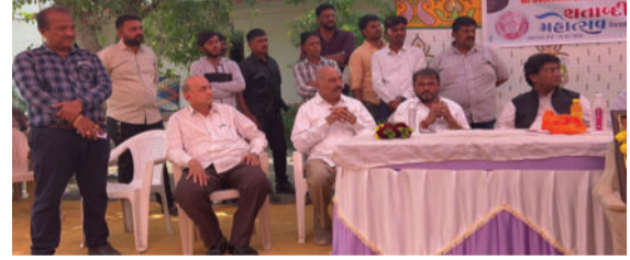
અને ગાંધી ચેરિટી લાયબ્રેરી ગાંધી લાયબ્રેરીની વિકાસગાથા વર્ણવી હતી. ધારાસભ્ય

રાજુલા, તા.૨૦ રાજુલા શહેરની શ્રી કમળાબેન ૨. ગાંધી ફ્રી લાયબ્રેરીએ ૧૫ જાન્યુઆરી ૨૦૨૫ના રોજ ૧૦૦ વર્ષ પૂર્ણ કર્યાં છે. આ ઐતિહાસિક પ્રસંગે ૧૯ જાન્યુઆરીએ નિવૃત્તિ સદન ખાતે શતાબ્દી મહોત્સવની ભવ્ય ઉજવણી કરવામાં આવી હતી. કાર્યક્રમમાં મુખ્ય મહેમાન