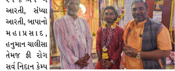
૨૧ જાન્યુઆરી, સંધ્યા આરતી, બાપાનો મહા પ્રસાદ, હનુમાન ચાલીસા તેમજ કી રોગ સર્વ નિદાન કેમ્પ સહિતના વિવિધ કાર્યક્રમોનું આયોજન આ બગડેશ્વર મહાદેવના મંદિરના સાનિધ્યમાં કરવામાં આવેલું હતું. આ કાર્યક્રમમાં બહોળી સંખ્યામાં લોકોએ હાજરી આપી હતી.

રાજુલા, તા.૨૦ રાજુલા શહેરમાં મીરાનગર ખાતર આવેલ બગડેશ્વર મહાદેવના સાનિધ્યમાં ગુરુ આશ્રમ ભેરાઈ રોડ ખાતે બજરંગદાસ બાપાની ૪૮ મી પુણ્યતિથિ નિમિત્તે વિવિધ કાર્યક્રમોનું આયોજન કરવામાં આવેલ હતું. જેમાં સવારથી જ વિવિધ કાર્યક્રમો શરૂ કરવામાં આવેલા સવારના