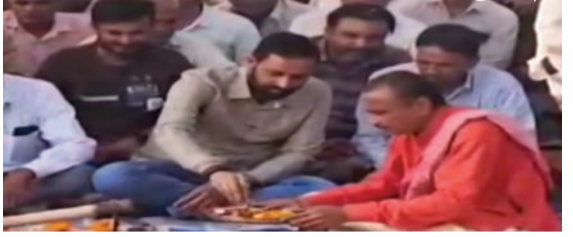
આચ્યું હતું. ગ્રામજનોએ પાણી તકે મોટી સંખ્યામાં ગ્રામજનો અને આગેવાનો મોટી સંખ્યામાં ઉપસ્થિત રહ્યા હતા.

અમરેલી, તા.૨૦ અમરેલી તાલુકાનાં સણોસરા ગામે ભૂગર્ભ પાણીનાં તળ ઉંચા આવે તે માટે સરકાર દ્વારા ચેકડેમ મંજૂર કરવામાં આવ્યો છે. પપ લાખ રૂપિયાનાં ખર્ચે તૈયાર થનાર ચેકડેમનું ખાતમુહૂર્ત ધારાસભ્ય અને નાયબ મુખ્ય દંડક કૌશિક વેકરીયાનાં હસ્તે કરવામાં