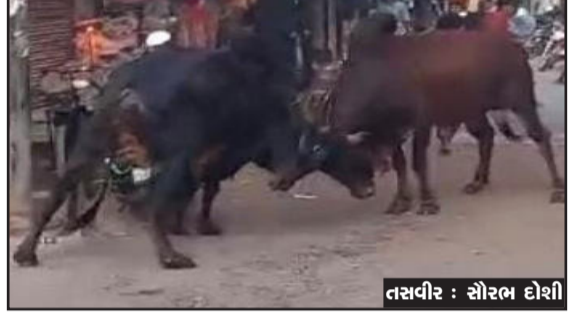
અવરજવર રહેતી હોય છે ત્યારે આ પ્રશ્નથી સૌ લોકો પરેશાન થઈ રહ્યા છે. થોડાક સમય પહેલા જ સાવરકુંડલાની

સાવરકુંડલાની મેઈન બજારમાં આખલા યુદ્ધ થતાં પસાર થતાં લોકો અને વેપારીઓનો જીવ તાળવે ચોંટી ગયો હતો. શહેરમાં અવારનવાર આ પ્રશ્નો થઈ રહ્યા છે. મેઈન બજારમાં મોટા પ્રમાણમાં વેપારીઓ હોય છે અને સતત વાહનોની પણ