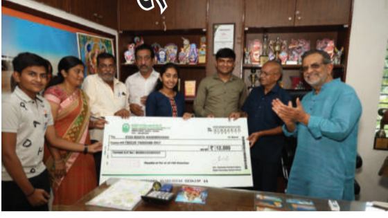
ધો. ૧૨ની લેવાયેલ પરીક્ષામાં પ્રથમ ક્રમાંક પ્રાપ્ત કરતા સંસ્થાના

અમરેલીમાં આવેલ એસ. એચ. ગજેરા સ્કૂલની વિદ્યાર્થીની નિષ્ઠા વ્યાસે તાજેતરમાં