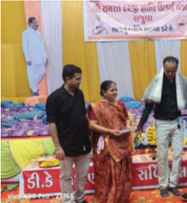
આ કાર્યક્રમને ખુલ્લો મુકવામાં આવ્યો હતો. વિદ્યાર્થીઓની સાથે

રાજુલા, તા. ૨૧ રાજુલા સમસ્ત દરજી જ્ઞાતિ મંડળ દ્વારા વિદ્યાર્થી ઈનામ વિતરણ કાર્યક્રમ યોજાયો હતો. આ ત્રિવિધ કાર્યક્રમમાં લોકડાયરો તેમજ ઈનામ વિતરણ કાર્યક્રમમાં સાધુ-સંતોએ હાજરી આપી હતી. કાર્યક્રમમાં ઉપસ્થિત રહેલા મહેમાનો દ્વારા દીપ પ્રાગટ્ય કરીને