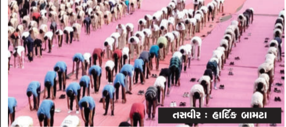
અમરેલી, તા. ૨૧ બગસરા મેઘાણી હાઈસ્કૂલ ખાતે યોગ દિવસની ઉજવણી કરવામાં આવી હતી. યોગ દિને