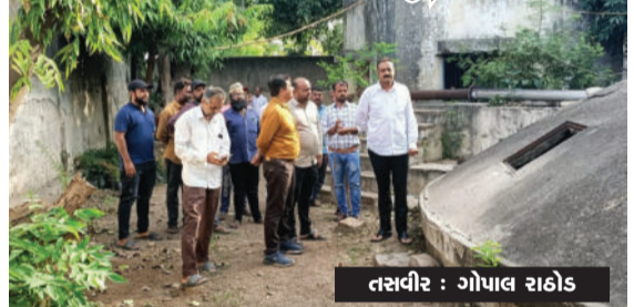
છેલ્લાં ઘણા સમયથી સફાઈ કામદારોના બાકી રહેતા પગાર નગરપાલિકા ઝડપથી ચુકવે