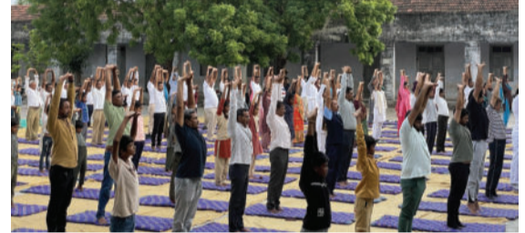
અમરેલી, તા. ૨૧ વડીયાની સુરગવાળા હાઈસ્કૂલ ખાતે યોગ દિવસમાં તાલુકાના અધિકારીઓ,